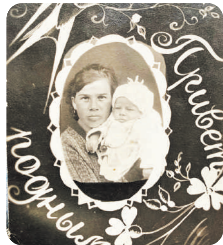
С мамой, 1941 год

Спустя 5 лет после школы поступил в Ленинградский Государственный педагогический институт имени А.И. Герцена. Отец и мачеха образование сына не одобряли, мол, работать надо, а не учиться. В холодильнике появились